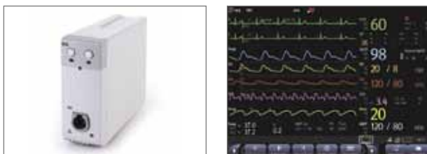
Модуль импедансной кардиографии (ICG)