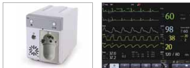
Модуль измерения CO 2