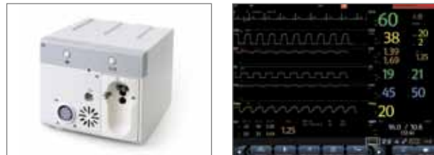
Модуль измерения смеси газов (мультигаз), O 2 , BIS