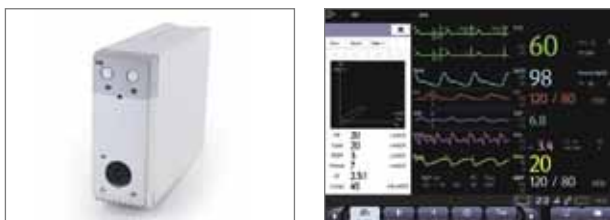
Модуль механики дыхания (RM)