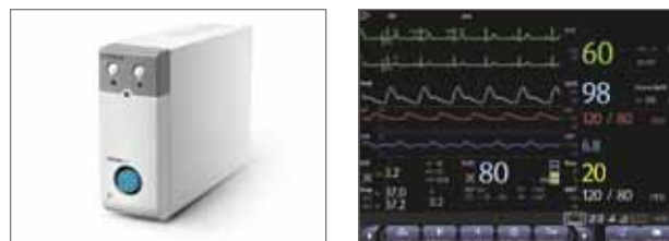
Модуль CCO/SvO 2