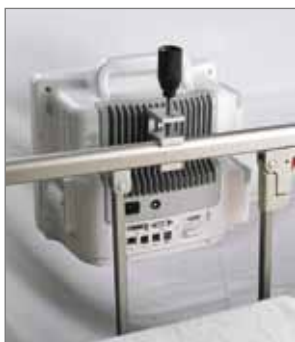
Зажим для крепления к кровати